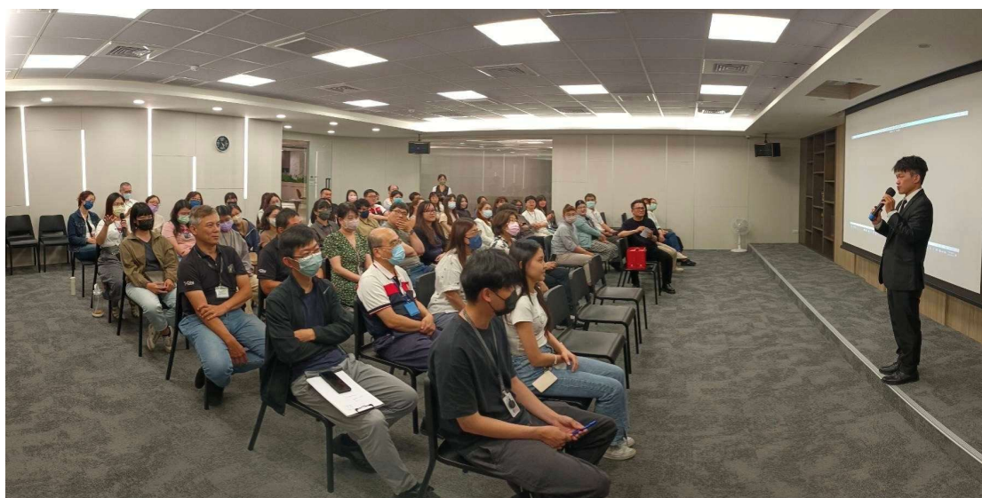
114 年 11 月 28 訓練實況如下：